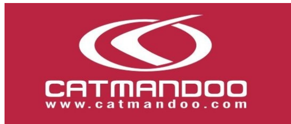
TABELA ROZMIARÓW ODZIEŻY CATMANDOO